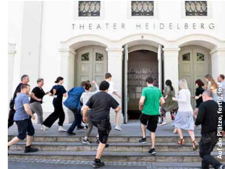
Auf alle Plätze, fertig!