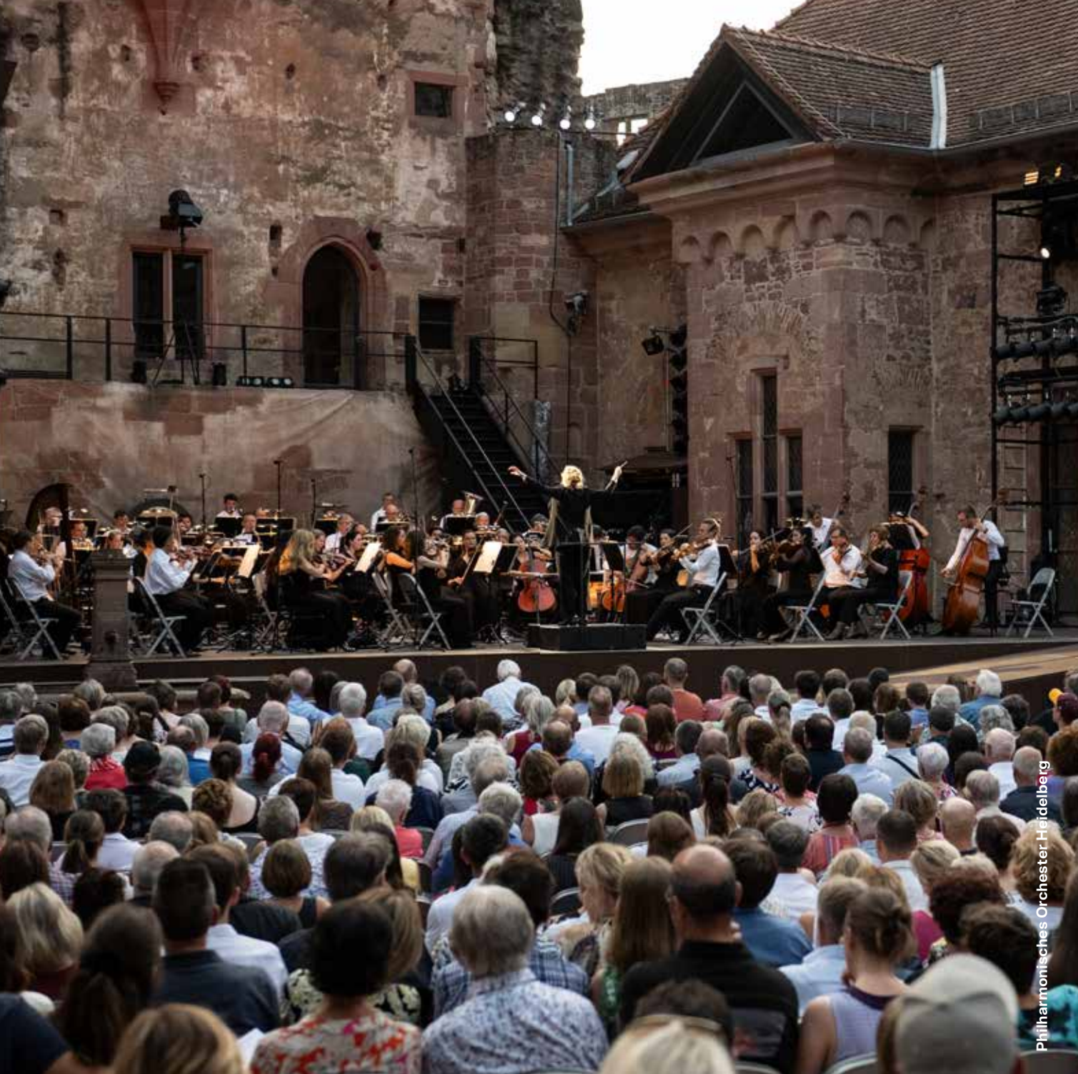
Philharmonisches Orchester Heidelberg